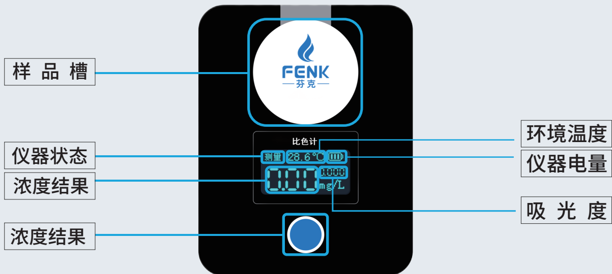
图2：比色计主机界面